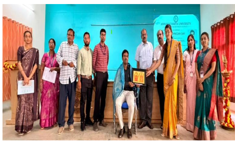
Tallapaka, Andhra Pradesh, India 64gq+v44, Boyanapalli, Tallapaka, Andhra Pradesh 516126, India Lat 14.226711° Long 79.137734° Friday, 13/03/2026 03:26 PM GMT +05:30